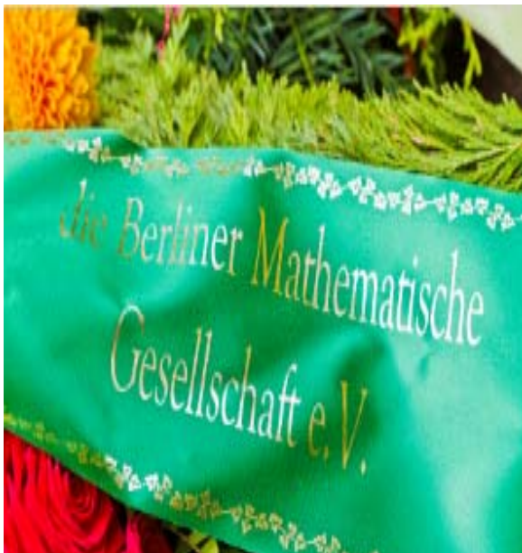
Gerhard Preuß' Ruhestätte